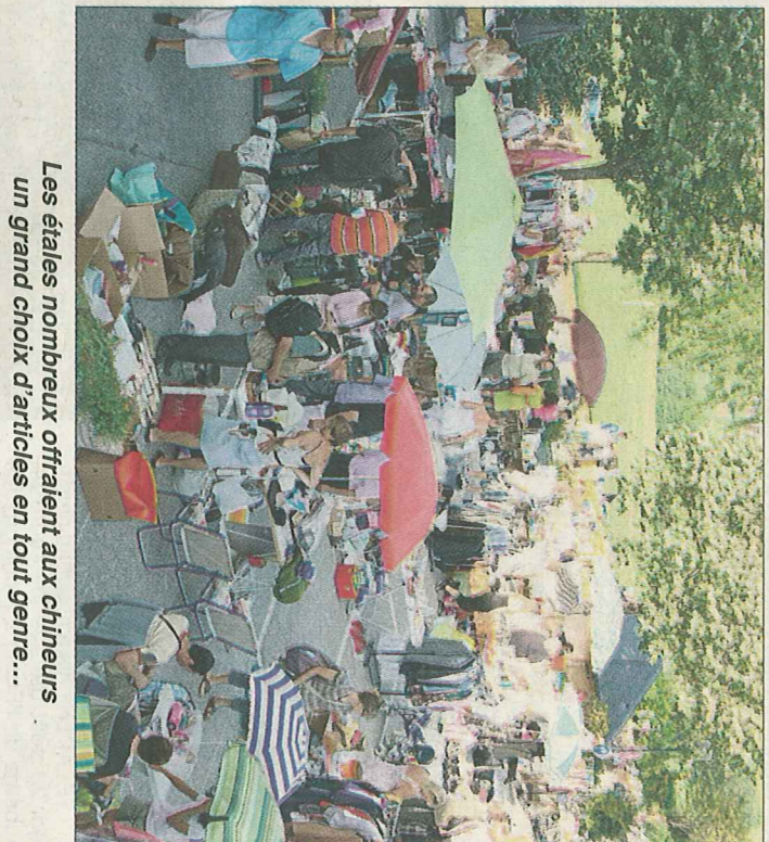
Les étalles nombreux offraient aux chineurs un grand choix d'articles en tout genre...

La prochaine permanence en mairie de Marcellaz-Albanais assurée par Mr