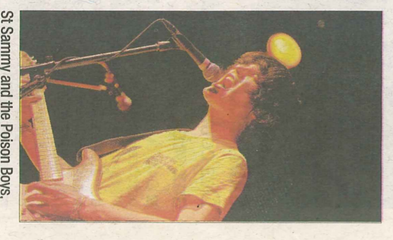
St Sammy and the Poison Boys, une expérience sonique Le DL/E.J.

Pour ce baptême du feu, ce sont les Matches et St Sammy and the Poison Boys qui ont mis les amplis à rude épreuve. Rock vintage pour l'un et expérience sonique pour l'autre, un choix musical audacieux.