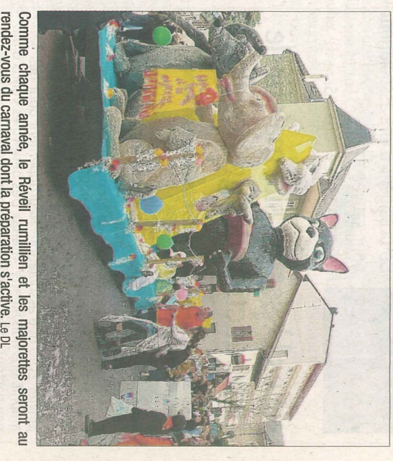
Comme chaque année, le Réveil rumillien et les majorités seront au rendez-vous du carnaval dont la préparation s'active. Le DL