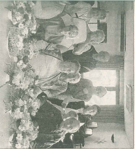
Les résidents de l'EHPAD.

mai, les résidents de l'EHPAD (Établissement) pour les Personnes Agées Dépendantes) ont organisé une manifestation florale qui servira de table pour le restaurant de la journée. Une manifestation organisée dans le cadre de la Journée de la Solidarité. Les 17 participants ont participé à la journée de plantation et ce fut une grande réussite. Tous les créateurs en herbe. Un moment entre les résidents et les animatrices.