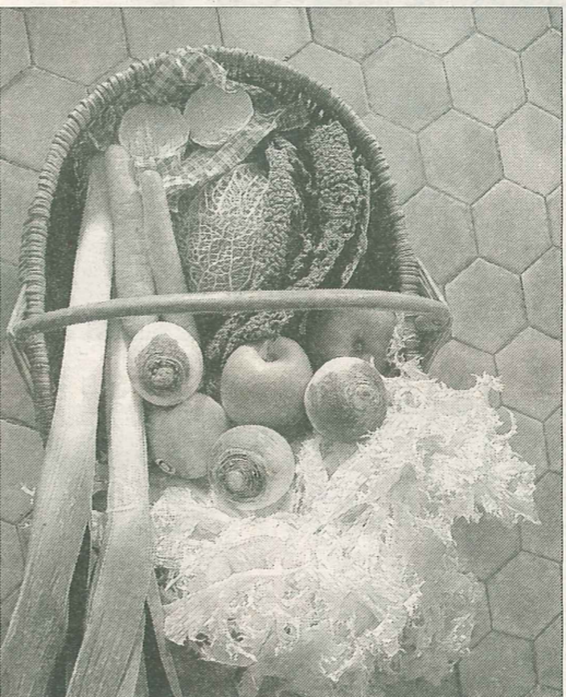
La distribution des premiers paniers de légumes débuta aujourd'hui.