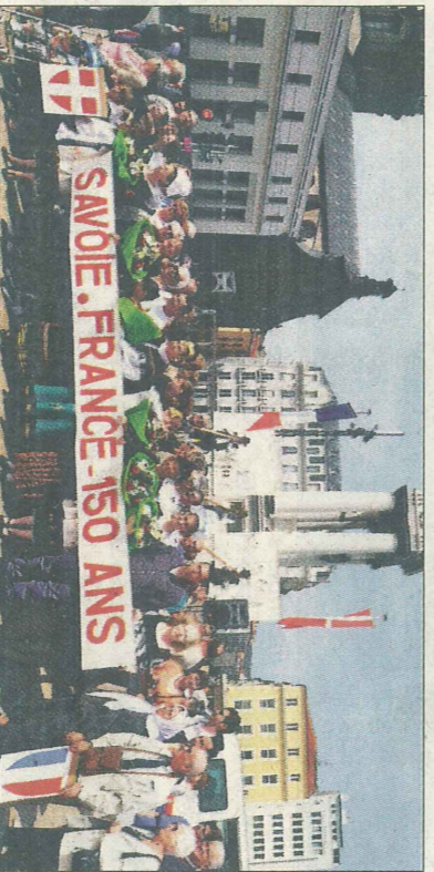
Les Savoyards d'Auvergne.

Suivait une allegorie folklorique : des Auvergnates et des Bretonnes accueillent des Savoyards en leur offrant des fleurs et le drapeau tricolore. L'assistance composée de Savoyards, de membres de l'UMAS et... de curieux se régala ensuite d'un concert de cors des Alpes interprété