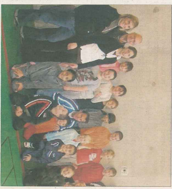
Mis en place l'an passé par le service sports de la ville, le dispositif est reconduit. Le DU/Archives

Pour plus de renseignements, vous pouvez contacter la Direction Sport et Vie associative au 04 50 64 69 20. Atousport sera présent au Forum des Associations le samedi 4 septembre à la salle des fêtes de Rumilly.