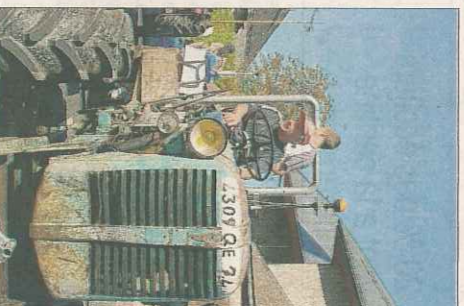
Les tracteurs seront en vedette.

Dimanche 29, des 9 heu- res, inscription des tracteurs vers la buvette, démonstra-